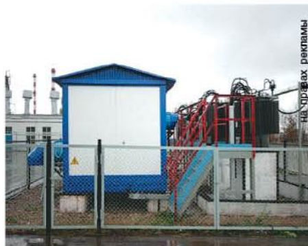
на объектах ректамы