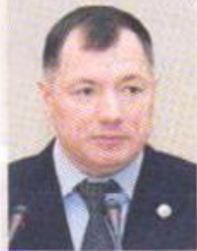
Министр строительства, архитектуры и жилищно-коммунального хозяйства Республики Татарстан Марат Хуснуллин

Примите сердечные поздравления с профессиональным праздником - Днем строителя! Профессия строителя - вне времени и моды. Это не просто профессия, это - призвание, талант, судьба. Качество жизни людей во многом зависит от честности, порядочности и верности строителей своему делу. Тысячи татарстанцев празднуют этот день, считая одним из главных праздников в своей жизни и жизни родных людей. Им известно, что в любом деле самое важное значение имеет надежный и крепкий фундамент.