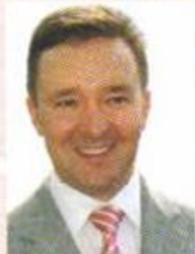
Премьер-министр Республики Татарстан Ильдар Халиков

Примите самые теплые и сердечные поздравления по случаю вашего профессионального праздника - Дня строителя!