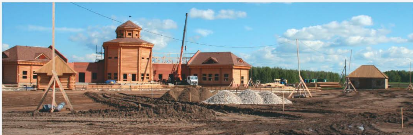
Создается множество новых объектов: строится мечеть с медресе, где будут обучаться шакирды, речная пристань, к которой летом будут причаливать пароходы с туристами, практически завершены работы по реконструкции Музея хлеба и построена мельница. В новой кузнице уже действует печь.

этого времени планируется завершить строительство одного из грандиозных сооружений в рамках программы возрождения комплекса - памятного знака в честь принятия ислама.