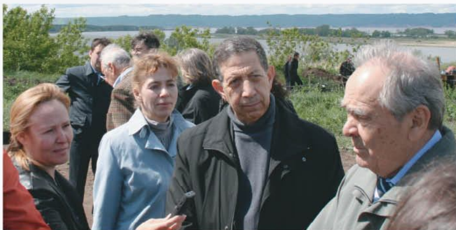
Генеральный директор Международного исследовательского центра по сохранению и реставрации культурных ценностей (ICCROM) Мунир Бушенаки и первый Президент Республики Татарстан, Государственный Советник РТ, председатель Попечительского совета фонда «Возрождение» Минтимер Шаймиев

РТ, подрядчики - ОАО «ТСНРУ», ОАО «Алексеевскдорстрой»), комплекса мечети Болгар (инвесторы - ОАО «Татнефть», Холдинг «Металлоинвест» и др., подрядчик - ООО «Грань») и Музея хлеба (инвестор - Министерство сельского хозяйства и продовольствия РТ (19 инвесторов), подрядчик - ОАО «Татагропромстрой») участники встречи говорили о возможности разных подходов к реставрации, выработывали дальнейший план работы. Научный аспект восстановления исторически ценных сооружений обсуждался далее на заседании Межведомственного научно-методического экспертного совета Республиканского фонда возрождения памятников истории и культуры РТ. Мунир Бушенаки заявил, что у Болгар и Свияжска есть реальные шансы на включение в список Всемирного наследия ЮНЕСКО.