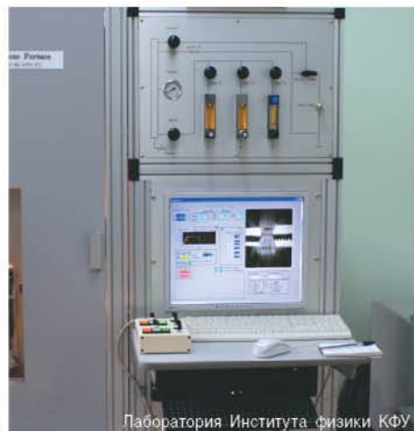
Лаборатория Института физики КФУ

восьми лабораториях Института физики установлены внутренние блоки климат-контроля. В общей сложности на цокольном этаже Института физики будет располагаться около тридцати лабораторий.