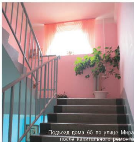
Подъезд дома 65 по улице Мира после капитального ремонта

На сегодняшний день в здании полностью заменены инженерные сети, заменены системы кондиционирования и вентилирования, в лабораториях установлена система подачи гелия. Двери всех лабораторий оборудованы кодовыми замками и специальными окошечками, которые позволяют наблюдать за происходящим внутри без вмешательства в процесс. По желанию заказчика, в