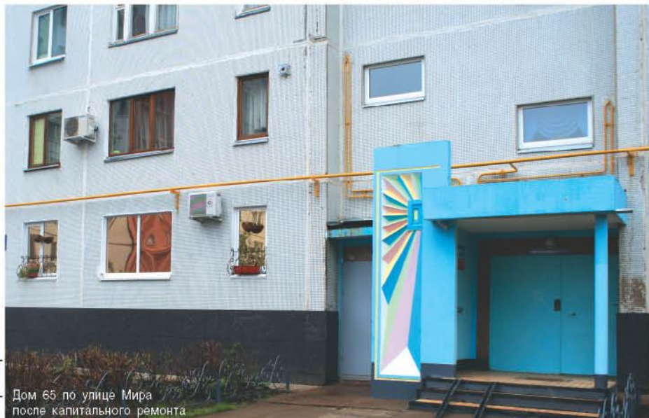
Дом 65 по улице Мира после капитального ремонта