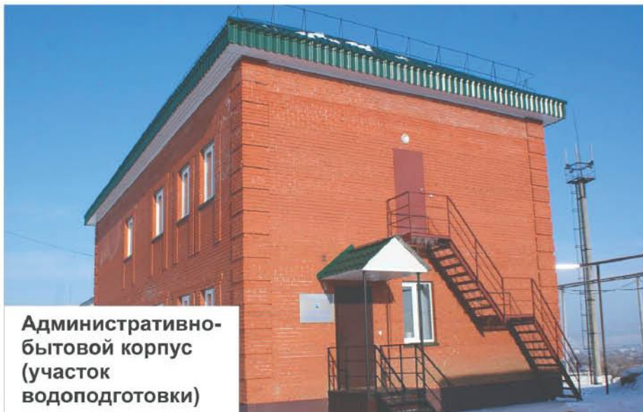
Административно-бытовой корпус (участок водоподготовки)

- Нет поводов оценивать стоимость, по которой мы отпускаем ее потребителю, как одну из высоких в республике. Она, скажем так, вполне обоснована. Начнем с того, что собственных источников водоснабжения ОАО «Альметьевск-Водоканал» не имеет. Поставку воды осуществляет УПТЖ для ПДД ОАО «Татнефть» с водозабора р. Кама на Бигаевские водоочистные сооружения. После доочистки на скорых фильтрах питьевая вода подается на станцию водоподготовки предприятия, где она обеззараживается и поступает по магистральным водопроводам в разводящую сеть города. Вернемся к стоимости: все познается в сравнении. Отпускная цена для населения у нас составляет 34,81 руб., а, например, в пгт Джалиль - 40,95 руб. А покупаем мы ее практически по одной цене. То же и с канализованием. Более того, по 2010 год включительно нам утверждался заведомо планово-убыточный тариф, не включающий затраты на модернизацию объектов, но даже в этих условиях мы умудрились выживать и обеспечивать бесперебойную работу оборудования и подачу воды населению.