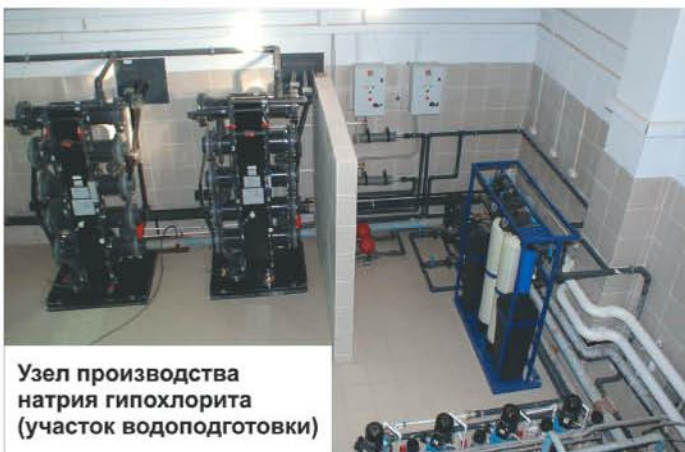
Узел производства натрия гипохлорита (участок водоподготовки)

- Альметьевск полностью отказался от использования хлора при очистке воды, перейдя на гипохлорит натрия. Что это дает потребителям воды?