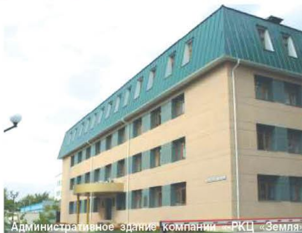
Административное здание компании «РКЦ «Земля»

Землю называют бесценным богатством. Но и она нуждается в учете и оценке. Сегодня не только специалисты, но и рядовые граждане наблюдают за тем, как последние несколько лет в России постепенно ликвидируется государственная монополия на землю, меняются каноны землепользования. Татарстан одним из первых среди регионов РФ не только декларировал, но и узаконил решение своего парламента о частной собственности на землю, а также принял Земельный кодекс. Реформы, осуществляемые в России и Татарстане, потребовали создания современного земельного кадастра.