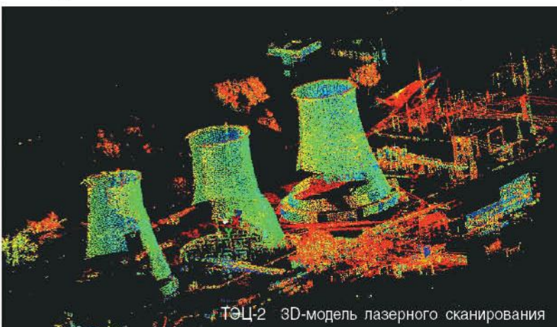
ТЭЦ-2 3D-модель лазерного сканирования

Геодезической компанией «Зенит» проведен ряд экспериментальных