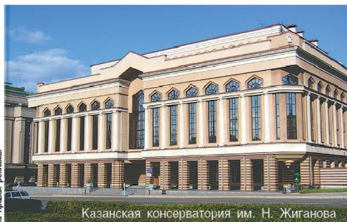
Казанская консерватория им. Н. Жиганова

ОАО «Нижнекамск-нефтехим» и ОАО «Нижнекамский НПЗ», реконструкция сетей связи и аэронавигации международного аэропорта «Казань», системы трансляции Ледового дворца в Йошкар-Оле.