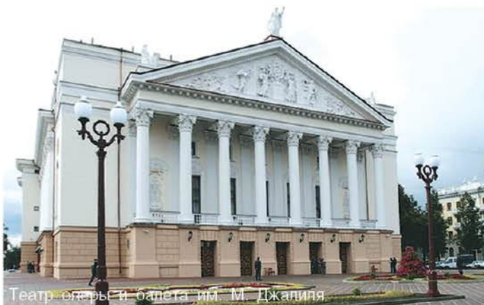
Театр оперы и балета им. М. Джалиля