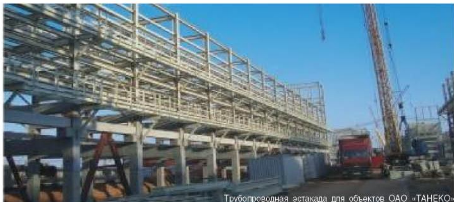
Трубопроводная эстакада для объектов ОАО «ТАНЕКО»

- Дорогие ветераны Великой Отечественной войны и свидетели тех дней! С чувством глубокой признательности благодарим вас за совершенный подвиг. В столь знаменательный день примите искренние поздравления и пожелания крепкого здоровья, долголетия, благополучия и мирного неба над головой. С праздником!