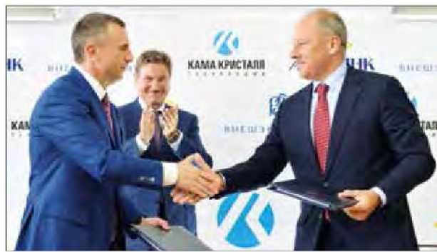
Подписание кредитного соглашения с Внешэкономбанком 27 июня 2014 года для строительства завода по производству синтетического сапфира для оптоэлектроники (г. Набережные Челны)