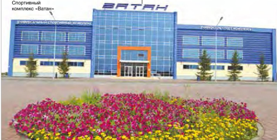
Спортивный комплекс «Ватаң»

Реализация комплекса мероприятий строительной отрасли республики позволит выйти на устойчивый тренд увеличения количества жилья и создание необходимых условий для инвестиционной и потребительской активности на рынке жилья, обеспечив платежеспособный спрос и реализацию социальных гарантий по улучшению жилищных условий граждан, имеющих право на меры государственной поддержки. ●