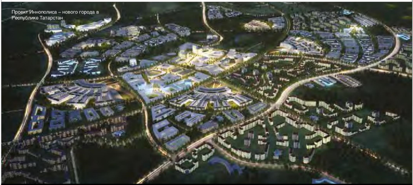
Проект Иннополиса – нового города в Республике Татарстан