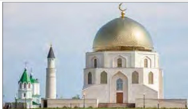
Памятный знак в честь принятия ислама (г. Болгар)