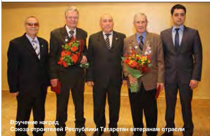
Вручение наград Союза строителей Республики Татарстан ветеранам отрасли