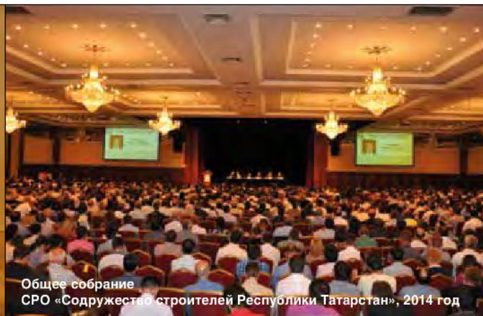
Общее собрание СРО «Содружество строителей Республики Татарстан», 2014 год

Татарстана». Союз ходатайствует о присвоении имен выдающихся строителей улицам и скверам городов республики, а также занимается созданием музея строительной славы.