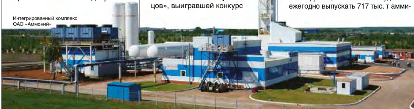
Интегрированный комплекс ОАО «Аммоний»

Идет строительство интегрированного комплекса ОАО «Аммоний» по производству аммиака, метанола и гранулированного карбамида в г. Менделеевске, этот проект реализуется на площадке завода по производству минеральных удобрений ООО «Менделеевсказот». Планируется, что комплекс будет ежегодно выпускать 717 тыс. т амми-