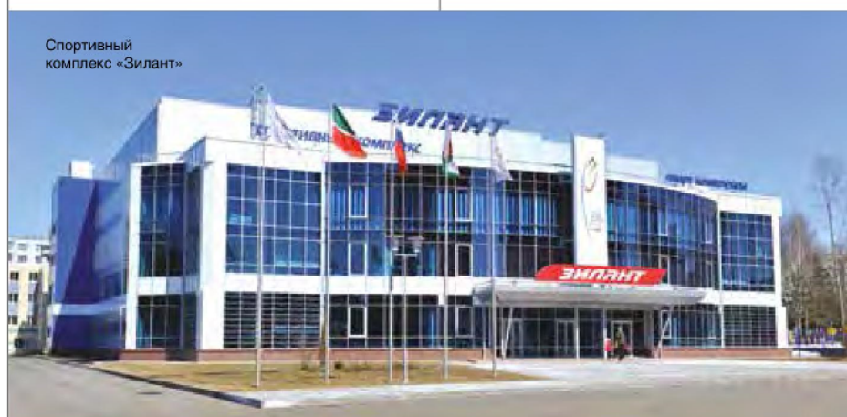
Спортивный комплекс «Зилант»

В работе над объектами Игр приняли участие архитекторы с мировым именем. Генеральная