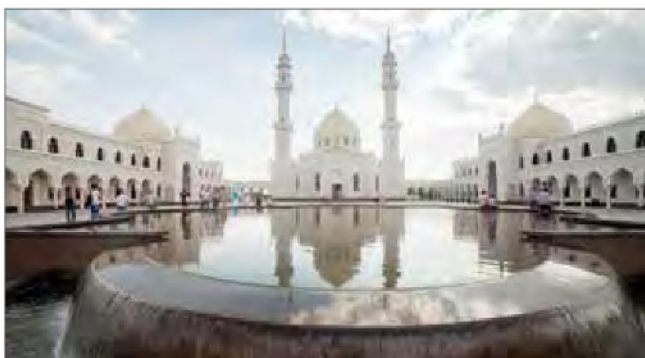
Комплекс Белой мечети (г. Болгар)

В настоящее время идет строительство жилого комплекса «Соловьиная роща» в г. Казани с общей площадью застройки 11,2 га и площадью жилых помещений 100 460,74 кв. м, а также завода по производству синтетического сапфира для оптоэлектроники в г. Набережные Челны Республики Татарстан. ●