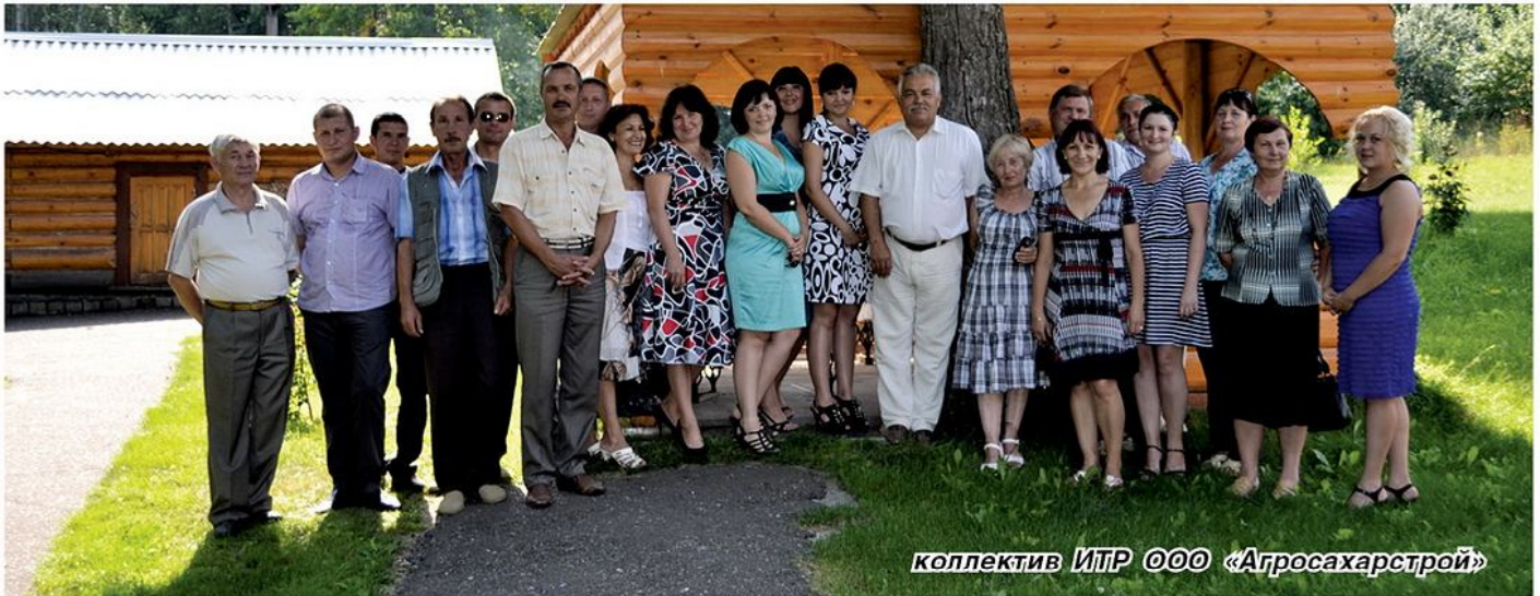
коллектив ИТР ООО «Агросахарстрой»

- отмечает руководитель. – При этом минимизировать расходы на строительство, выдавая оптимальный для эксплуатации объект. Ужесточаются экологические требования. Чем крупнее комплекс, тем больше вопросов, которые приходится решать. Скажем, тот же вопрос утилизации навоза, который в Европе решен благодаря использованию биогазовых установок. Появляются новые строительные материалы - стараемся следить за новейшими достижениями в этой области и применять их. Категорически не применимы в наших условиях «холодные методы». Все эти факторы в конечном итоге удорожают процесс. Если в Европе обустройство одного коровоместа новой фермы обходится в 3-5 тысяч евро, то у нас от 5 тыс. евро и больше. Конечно, без поддержки государства не обойтись. И оно помогает.