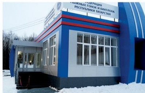
спортивная база «Ялта Зай» Первый объект 2013 года

Разумеется, востребованность компании обеспечивает не только практический опыт, но и ее кадровый состав. Примечательно, что костяк «Агросахарстрой» на протяжении нескольких лет остается неизменным и составляет около 100 сотрудников. Притом, что сегодня на рынке строительства отмечается дефицит бетонщиков, арматурщиков и многие компании предпочитают нанимать приезжих из бывших союзных республик. «Агросахарстрой»