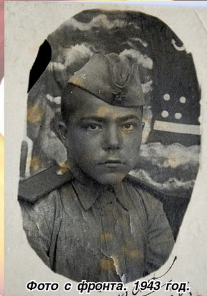
Фото с фронта, 1943 год.

Возможно, этот факт подтолкнул неутомимого ветерана к созданию серии документальных книг о военачальниках, генералах – татарах, воевавших на фронтах Великой Отечественной, о женщинах-фронтовичках, Героях Советского Союза и юных партизанах, сражавшихся в 1941-1945 годах. Его кропотливый труд не прошел даром, после продолжительных переписок в Интернете с родственниками ветеранов удалось разыскать около двадцати фамилий генералов-татар, стойко и храбро воевавших в годы войны с фашистами. Наравне с мужчинами на фронтах героически сражались женщины и дети, защищая страну от захватчиков. (От автора. Книги «Генералы-татары», «Женщины-фронтовички», «Юные партизаны Великой Отечественной войны» изданы автором-составите-