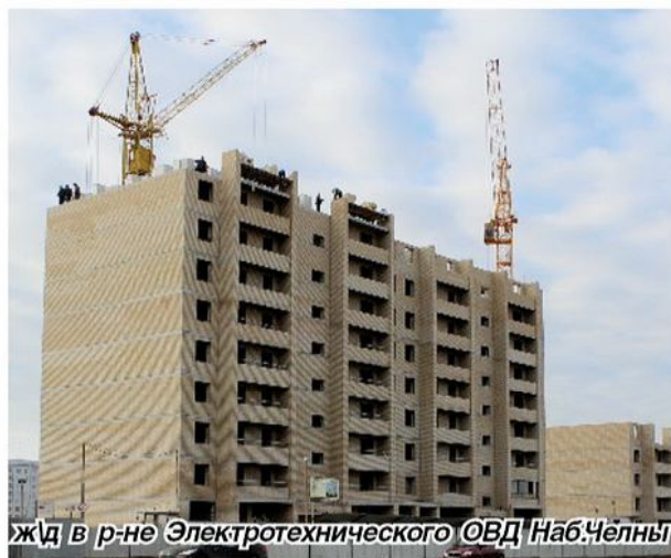
ЖД в р-не Электротехнического ОВД Наб.Челны

Отрадно отметить, занимаясь оказанием специализированных услуг, фирма «Челныстройподряд» поддерживает тесные партнерские отношения с такими подрядными организациями как «Домостроительный комбинат», УКС «Камгэсэнергострой», «Строительно-монтажный трест Домостроительного комбината», «Стройтраст», «Татэнергомонтаж», «Строительная группа - Центр». В особо доверительном сотрудничестве работают и с поставщиками материалов, это – «РегионСтройКомплект», ТД «СтройСантехМонтаж», «Рид-мет», «Элита Казань», «Энергоснаб» и др.