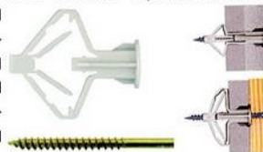
Рис.6. Дюбель Дрива. Идеально подходит для тех случаев, когда вам необходимо повесить на стену из гипсокартона часы, картину или что-либо имеющее небольшой вес.

Рис.5. Дюбель «Бабочка». Предназначен для крепления в гипсокартон. Он устроен таким образом, что при затягивании саморезом стенки дюбеля складываются и плотно прижимаются к задней стороне гипсокартонной стены, тем самым прочно фиксируя саморез.