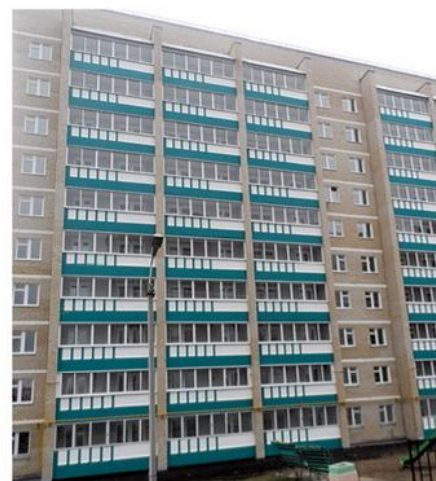
Жилой дом 9-27 в пос. ГЭС

РТ, г. Набережные Челны, Тел: 8 (8552) 44-05-25 e-mail: smf-51@yandex.ru