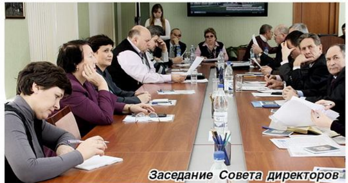
Заседание Совета директоров