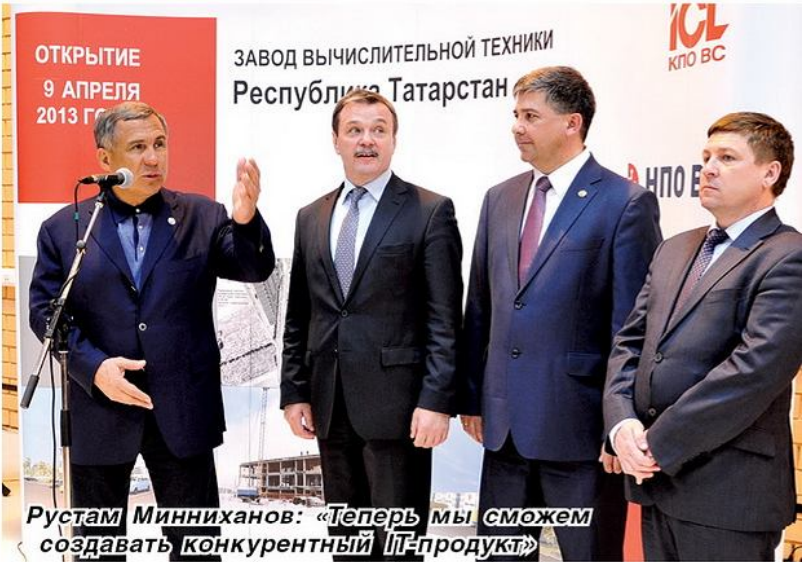
Рустам Минниханов: «Теперь мы сможем создавать конкурентный IT-продукт»

ложения завода, который находится недалеко от второй площадки ОЭЗ «Иннополис».