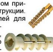
Рис.7. Дюбель для пенобетона. Для крепления в рыхлых и мягких материалах, таких, как газобетон, пенобетон нельзя использовать традиционные дюбели. Отверстие под таким крепежом может увеличиться под собственным весом прикрепленной конструкции. Особенностью дюбелей для пенобетона являются большие рёбра, создающих большую площадь соприкосновения с поверхностью материала.

Помните! При работе с дюбелями шуруп нужно подбирать чуть длиннее самого дюбеля, чтобы он смог полностью раскрыться с учётом толщины прикрепляемого материала.