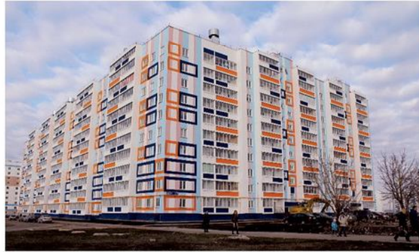
ЖД 36-8-1 Наб.Челны