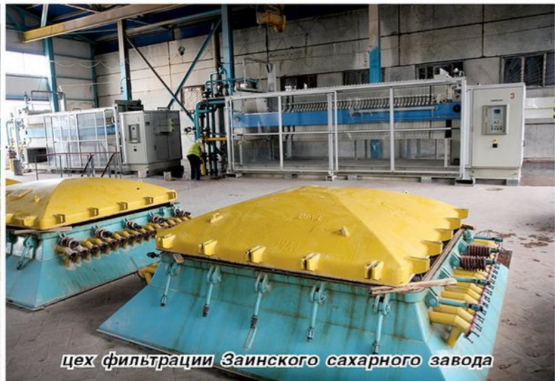
цех фильтрации Заинского сахарного завода