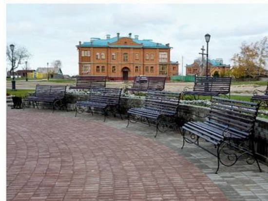
Благоустройство территорий отеля "Ибис" (верхний снимок) и Острова-Града Свяжск (нижний)