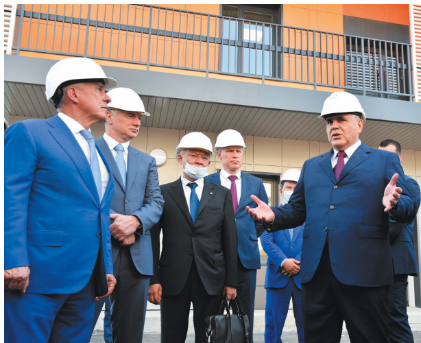
📍 На открытии инфекционной больницы в Казани, 2020 г.

по избранной профессии начал еще на студенческой скамье, вступив в существовавший при вузе студенческий строительный отряд «Архимед», попасть в который было совсем непросто.