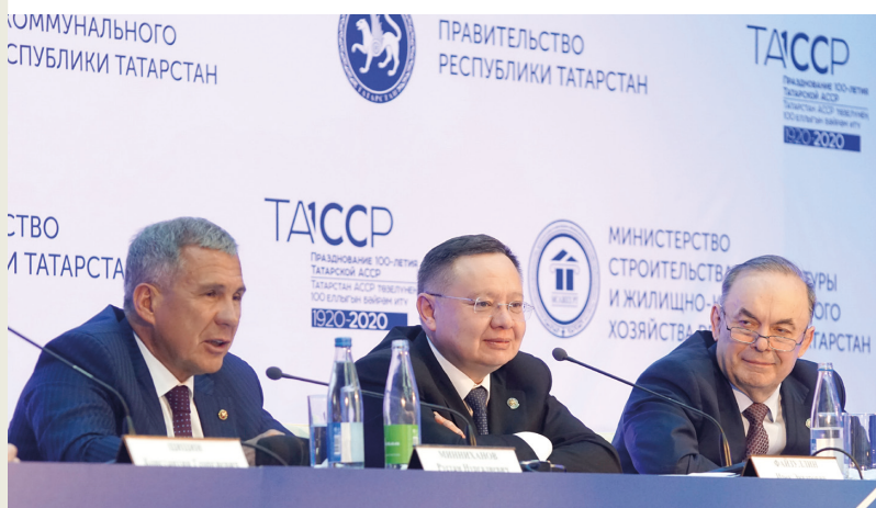
Итоговая коллегия Министерства строительства, архитектуры и ЖКХ РТ, 2020 г.