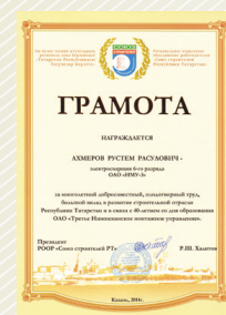
Грамота Союза строителей Республики Татарстан

За многолетний добросовестный, плодотворный труд, значительный вклад в развитие строительной отрасли Республики Татарстан и в связи со знаменательным юбилеем награждены: