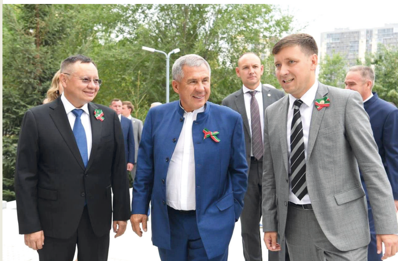
☉ День республики, 2022 г.