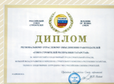
Диплом Российского Союза строителей