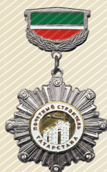
Нагрудный знак «Почетный строитель Татарстана»