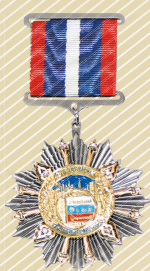
Орден «За заслуги в строительстве»