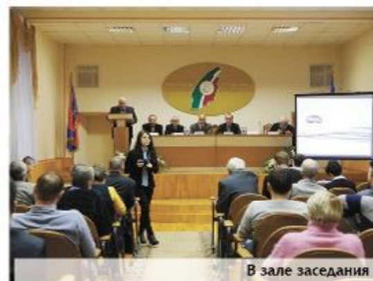
В зале заседания