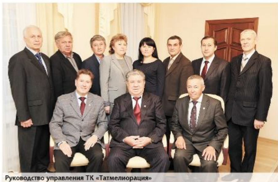
Руководство управления ТК «Татмелиорация»

Силами мелиоративных подразделений в кратчайшие сроки после небывалой засухи 2010 года была успешно реализована республиканская программа «Модернизация и энергоэффективное технологическое обновление мелиоративного комплекса в Республике Татарстан на 2011-2012 годы», в результате которой на полях республики заработали 240 современных дождевальных машин и 169 насосных станций, проложено более 140 км. магистральных трубопроводов, что позволило восстановить более 10 тыс. га орошаемых земель и увеличить производство сельскохозяйственной продукции и заготовку кормов для животноводства. Благодаря этой Программе республика на многие годы полностью обеспечила свои