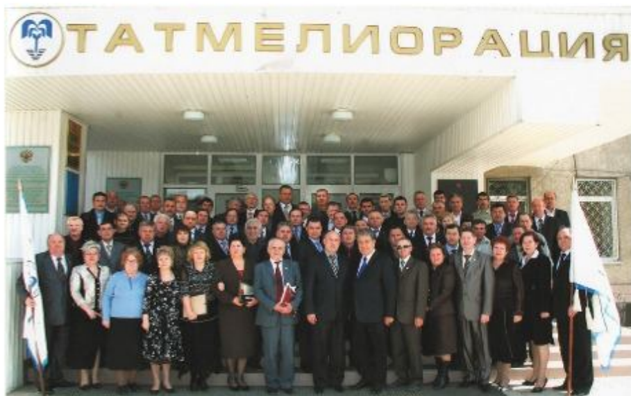
Руководители мелиоративных подразделений Республики

Мелиораторами Татарстана в рамках различных программ за последние десять лет построено и реконструировано 320 гидротехнических и противозерозионных сооружений, введено в эксплуатацию 21,5 тыс. га орошаемых земель, пробурено около 800 артезианских скважин на воду и проложено более 600 км. водопровода, построено и проведен капитальный ремонт 46 многоквартирных и 29 индивидуальных жилых домов для ветеранов Великой Отечественной войны.