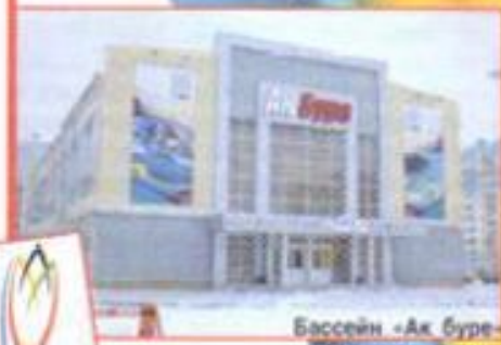
Бассейн «Ак буре»