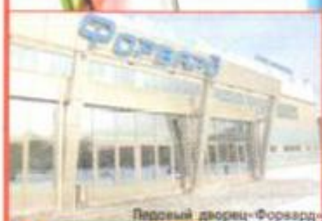
Ледовый дворец «Форвард»