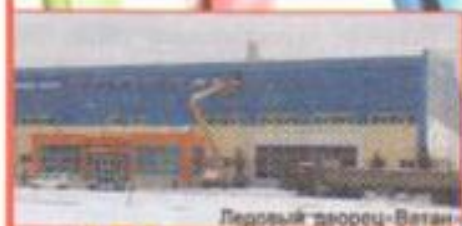
Ледовый дворец «Ватан»