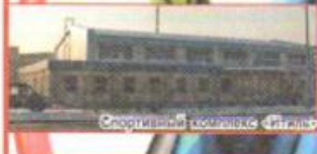
Спортивный комплекс «Низкий»