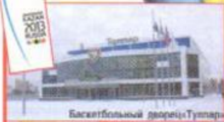
Баскетбольный дворец «Тутпар»