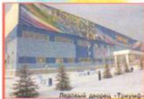
Ледовый дворец «Триумф»