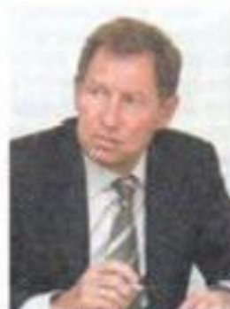
Президент Российского Союза строителей В.А.ЯКОВЛЕВ