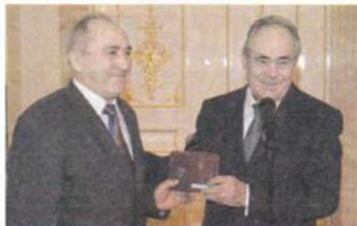
Президент Республики Татарстан Минтимер Шаймиев и Рим Халитов

Дорогие читатели! 3 февраля Президент РНП «Содружество строителей РТ» Рим Шафикович Халитов отмечает юбилейную дату своего рождения.