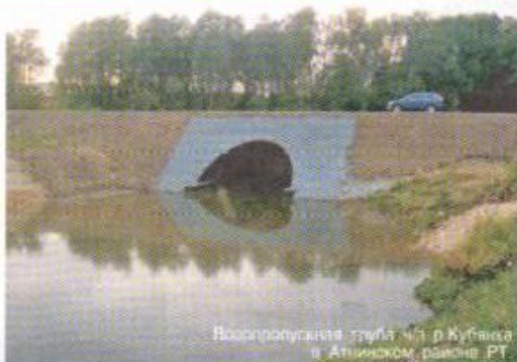
Воспроизводство графа 4-1 в Кукморском районе РТ

Буквально год назад у ООО «БАЗОВЫЙ ПРОЕКТ» появились заказчики в лице ОАО «Татавтодор» и ФГУ