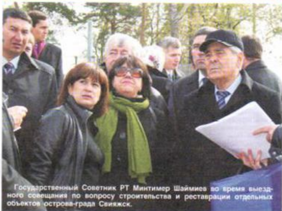
Государственный Советник РТ Минтимер Шаймиев во время выездного совещания по вопросу строительства и реставрации отдельных объектов острова-града Свияжск.

проживающих в ветхих домах муниципалитета на территориях Болгара и Свияжска. К примеру, на сегодня в Болгаре на территории городища и со стороны Южных врат проложены все дороги. А в Свияжске не так давно состоялся торжественный пуск газа в первый дом. За два месяца полностью газифицировали остров. Идет реконструкция исторических зданий, реставрация культовых сооружений. Спроектирован новый комплекс, состоящий из мечети и медресе для Болгар. Также началось сооружение Памятного знака в честь официального принятия ислама в 922 году.