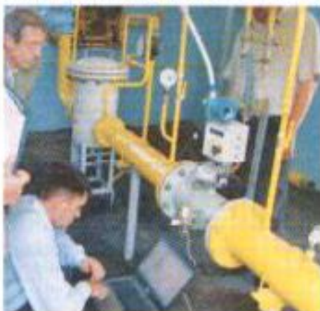
на фото: реконструкция