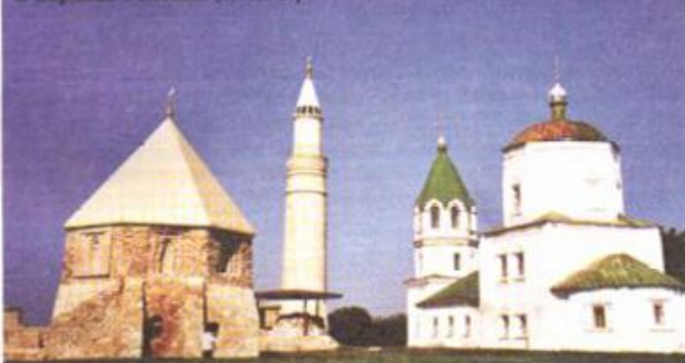
Болгары Восточный минарет, большой минарет (XII-XVII вв.) и церковь Успения (XVIII в.)

развития туризма и археологии, который ежегодно проходит в Италии под эгидой Президента Италии, ЮНЕСКО и ИККРОМ с участием более 10 тысяч специалистов из разных стран мира.