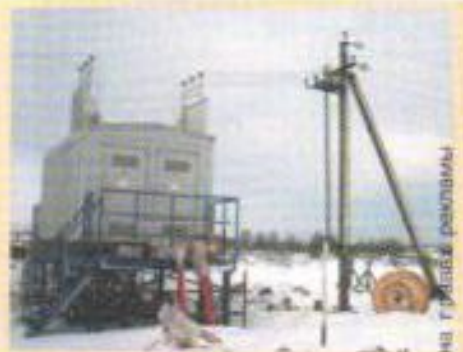
на г. Уфа, в разрывы